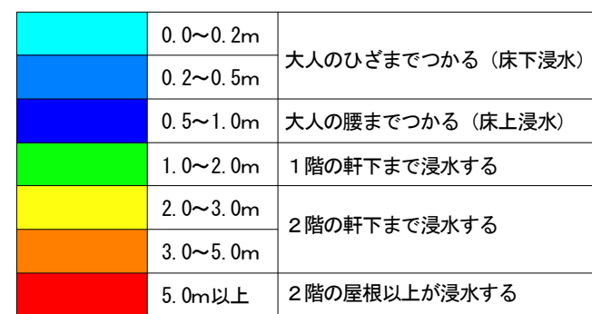
最大水深と浸水程度の目安