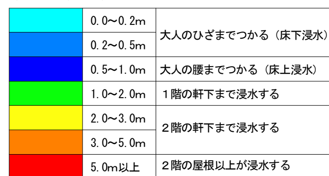
最大水深と浸水程度が目安